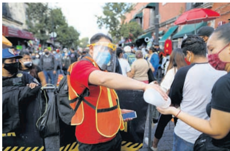
Mexico plans to be vaccinating its people against COVID-19 at the end of the third week of December, starting with health workers, the government announced Tuesday.

President Andrés Manuel López Obrador said the vaccines will be “universal and free” — and also voluntary — and he hopes the full population will be vaccinated by the end of 2021.